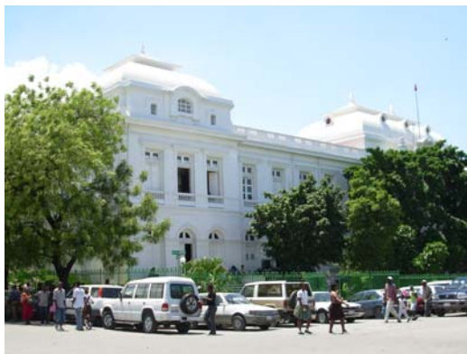
Le Palais de Justice de Port-au-Prince

Les assises criminelles sont l'un des moyens les plus sûrs d'arriver à endiguer le mal de la détention préventive prolongée qui ronge les prisons du pays.