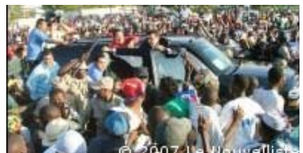
Le Président Hugo Chavez traversant une foule accueillante

Le Président Vénézuélien Hugo Chavez et l'un des Vice Président de Cuba ont effectué le 13 mars 2007 une visite de quelques heures à Port-au-Prince. Le Président Vénézuélien a été chaudement accueilli à l'Aéroport par des milliers de manifestants de sensibilité lavalassienne en majorité. Au terme de la visite, un accord portant sur la santé, l'énergie et le pétrole a été signé, suivi d'une conférence de presse au palais national par les représentants des trois pays. Selon le Président René G. Préval, cet accord n'est pas basé sur des intérêts (bailleur/débiteur). Il porte sur la fourniture de 14.000 barils de pétrole par jour par le Vénézuéla dans le cadre du programme «Pétrocaribe»; l'arrivée prochaine des techniciens cubains et vénézuéliens pour la construction de trois centrales électriques d'une capacité de 40 mégawatts aux Gonaïves, au Cap-Haïtien et à Port-au-Prince; un fonds de coopération humanitaire de 21 millions de dollars, créé par le Vénézuéla en faveur d'Haïti. Ce fonds servira à l'acquisition d'équipements médicaux et à l'hébergement de nouveaux médecins cubains qui seront envoyés en Haïti.