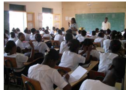
Une séance d'Éducation Plus dans le Nord

D'une manière générale, les élèves se sont montrés très attentifs. Plusieurs d'entre eux ont pu répondre aux questions relatives à la première intervention. A la fin de ces exposés, ils étaient aptes à parler de la Constitution, son rôle, son importance dans une société démocratique, à identifier plusieurs