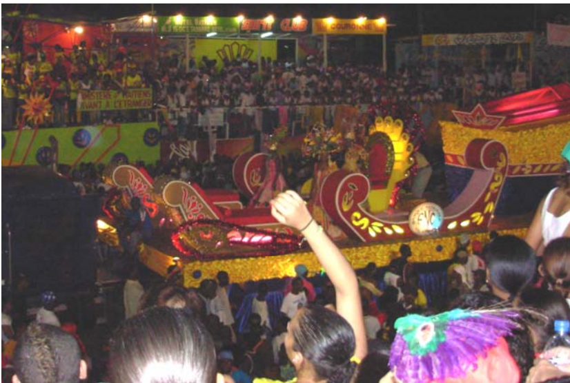
Plusieurs personnes célébrant le carnaval « Soley Leve »

M usique, couleurs, costumes, foule... nombreux sont ceux qui, pendant les trois jours gras, du 18 au 20 février 2007, se sont rassemblés sur le Champ de Mars pour l'événement culturel le plus attendu de l'année en Haïti : le Carnaval, dont le thème cette année était « Soley Leve ».