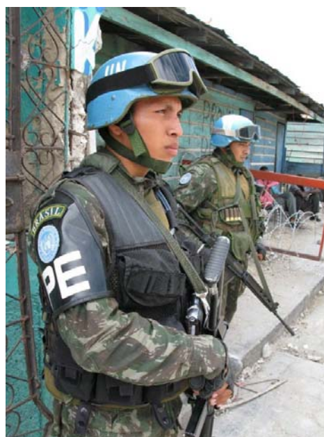
Des soldats ONU lors d'une opération à Cité Soleil