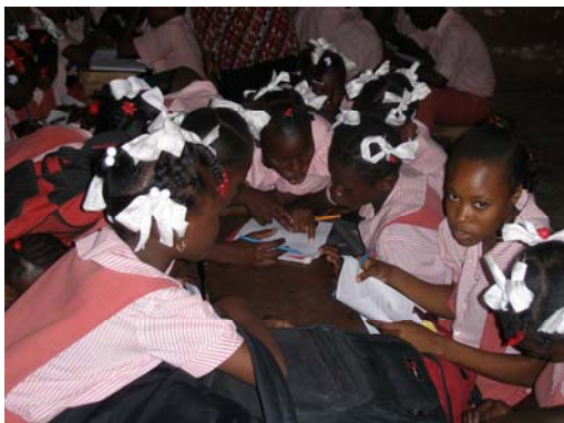
Une groupe d'élèves du Nord évaluant leurs connaissances en droits humains.