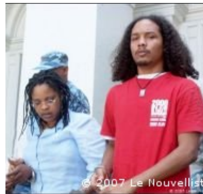
Des condamnés sortant du Palais de Justice de Port-au-Prince