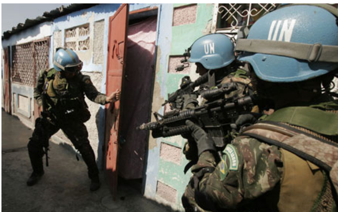
Des soldats de la MINUSTAH au cours d'une intervention à Cité Soleil

son à Cité Soleil. Selon les forces onusiennes, cette maison servait de base aux activités criminelles de plusieurs gangs localisés dans la cité et opérant à Port-au-Prince.