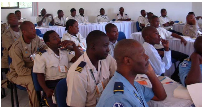
Des policiers, suivant attentivement, à Mirebalais, un exposé sur les droits humains.

Rappelons que cette session de formation est un des volets du programme de formation du RNDDH adressé aux policiers haïtiens dont l'objectif est de réduire les actes de violation des droits humains et de rapprocher la police de la population.