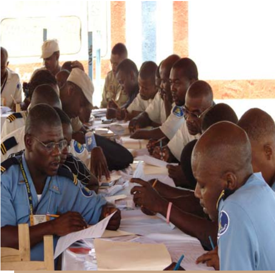
Des policiers travaillant en atelier, lors de la formation réalisée par le RNDDH à Jérémie

Les 17 et 18 août 2007, le Réseau National de Défense des Droits Humains (RNDDH) a organisé un séminaire de 2 jours au bénéfice des membres de la Police Nationale Haïtienne (PNH) dans le Département de la Grande Anse. Ce séminaire était organisé en partenariat avec La Direction Générale de la Police Nationale d'Haïti (DGNPH) et avait réuni des policiers, des agents de l'Administration Pénitentiaire, des agents de l'unité spécialisée (UDMO) ainsi que des représentants de la mission des Nations Unies en Haïti (MINUSTAH). L'objectif de cette formation était de renforcer les connaissances théoriques des policiers en matière de droits humains et de rapprocher la PNH de la population dans la perspective de la réduction des violations des Droits Humains.