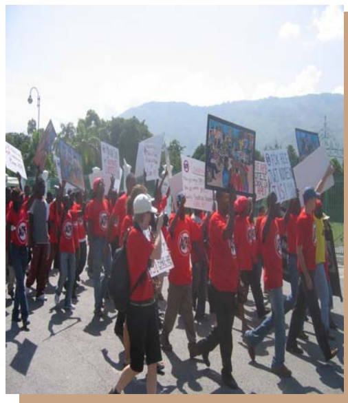
Une marche pacifique organisée par la Coalition Bare APE

listes a eu lieu le 26 septembre, en prémisses à la Conférence-Débat et à l'exposition qui ont eu lieu le 27 septembre à l'occasion de la Journée mondiale contre les APE. Des rencontres avec différentes instances nationales et internationales pour les informer des impacts négatifs de la signature de ces accords et des recommandations que nous proposons auront lieu jusqu'au 13 octobre. Les activités se clôtureront avec la venue des ministres du CARIFORUM en Haïti pour discuter des APE: une marche pacifique, une pétition, et une déclaration assorties de recommandation sont prévues pour le 15 octobre.