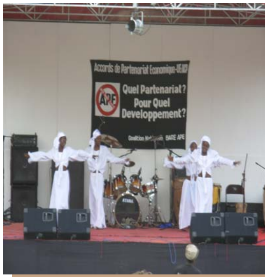
Activités culturelles organisées par la Coalition Bare APE

Le 27 septembre 2007, à l'occasion de la Journée mondiale contre les Accords de Partenariat Economique (APE), une grande mobilisation a eu lieu pour protester contre la signature des APE. Quelques pays ACP (Afrique – Caraïbes – Pacifique), mais également des pays européens, ont mené diverses actions pour faire valoir leur point de vue sur ces accords économiques qui risquent d'entrer en vigueur à partir du 1 er janvier 2008.